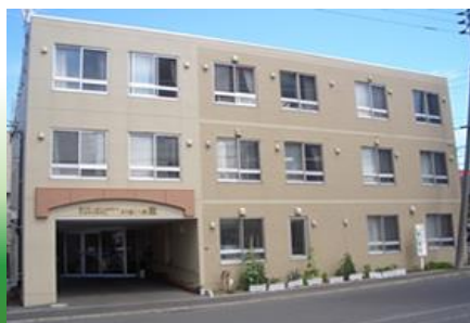
グループホームいきいき栄