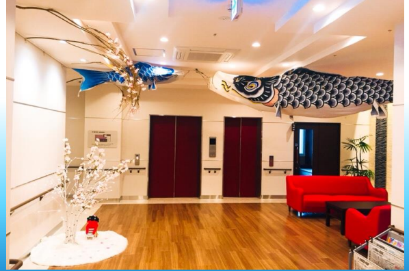
ロビーで泳ぐ鯉のぼり