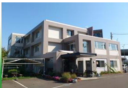
グループホームいきいき