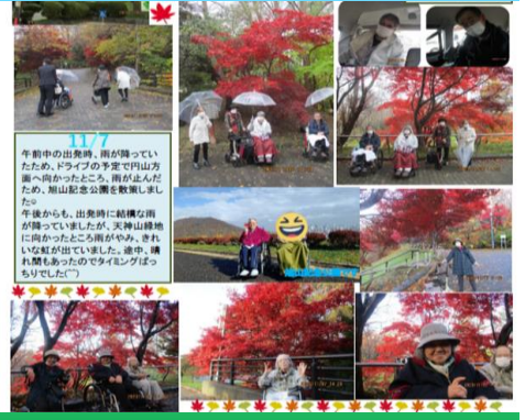
イオル平和通 スマイルライフ はコチラから