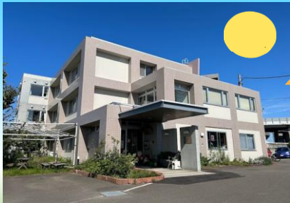
グループホームいいきき