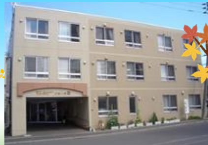
グループホームいいきき栄