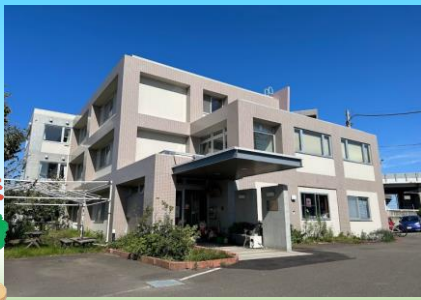
グループホームいきいき