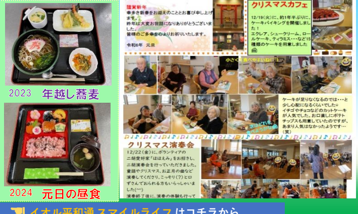
イオル平和通 スマイルライフ はコチラから