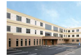
サービス付き高齢者向け住宅 イオル美園 札幌市豊平区 / 2013年7月開設 <併設事業所>