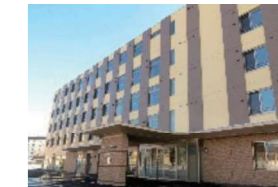
サービス付き高齢者向け住宅 イオルもみじ台 札幌市厚別区 / 2014年2月開設 <併設事業所>