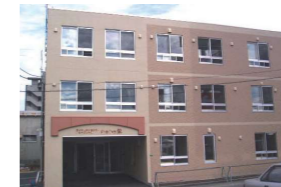
認知症対応型共同生活介護 グループホームいきいき栄 札幌市東区 / 2005年10月開設 <併設事業所>