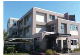
認知症対応型共同生活介護 グループホームいきいき 札幌市白石区 / 2003年4月開設 <併設事業所>