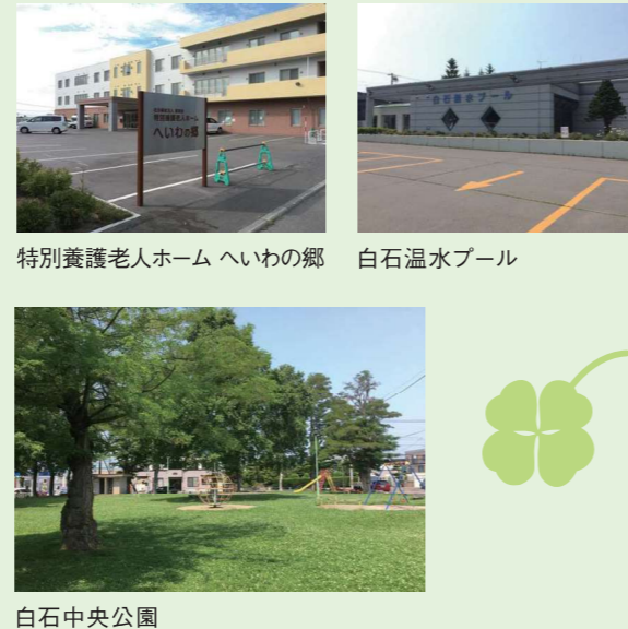
特別養護老人ホーム へいわの郷 白石温水プール