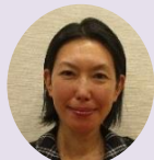
せんだい みどり 仙台 緑

その他にもフロント販売やお風呂の準備と声掛けなど、住宅内での様々な細かい業務を行っています。