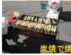
炭焼で焼くとおいしい