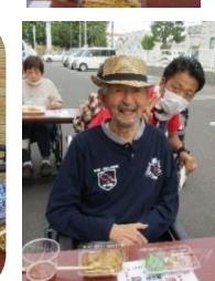
アルコールビールでも 外で飲むと最高!!