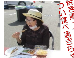
焼き鳥って つい食べ過ぎちゃう🍗