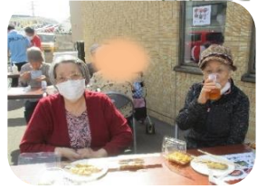
居酒屋さんみたいですね～(笑)

天気が心配だったのですが、飛行機雲が出るくらいの晴天で、準備を担当していた職員が日焼けしてました☺9月とは思えないような暖かい日でした☀