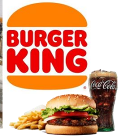
全部食べれるかな？

2階は11名、4階は24名の方が参加されました！こちらが思っていた以上に好評だったので、ぜひまた開催したいと思います♪