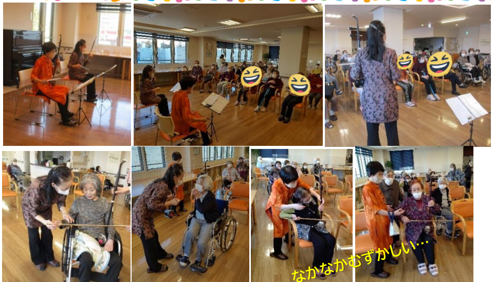
なかなかむずかしい…

演奏終了後に、演奏の体験も行って下さいました。素敵な演奏と、貴重な体験をありがとうございました◎