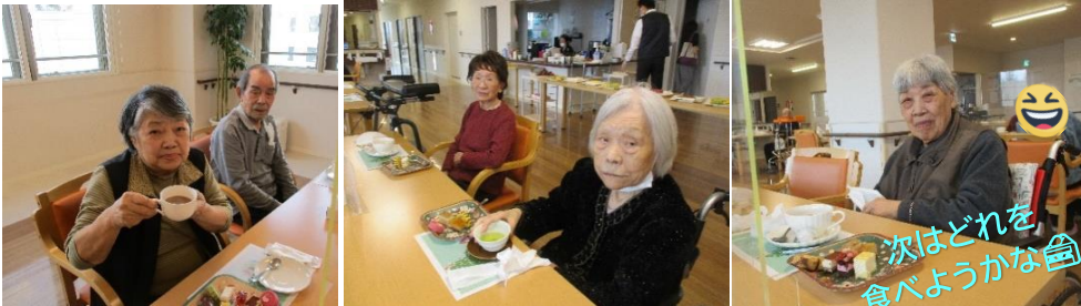
次はどれを食べようかな(笑)

ケーキが足りなくなるのでは…と少し心配になるくらいでした◎ イチゴやチョコなどのカットケーキが人気でした。お口直しにポテトチップスも用意していたのですが、あまり人気はなかったようです…(笑)