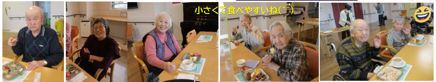
小さくて食べやすいね(^^)