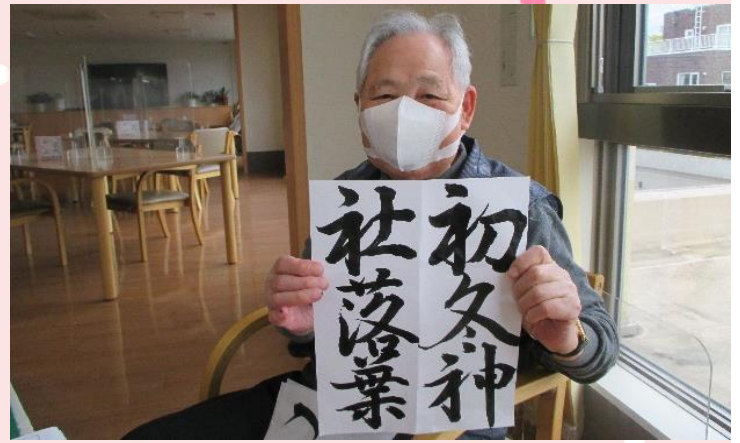
さすが！！かっこいい作品ですね(*^^*)