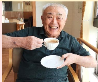
いつもお湯を準備してくれる応援隊長 (イオル町内会長も兼務しているとか(笑))