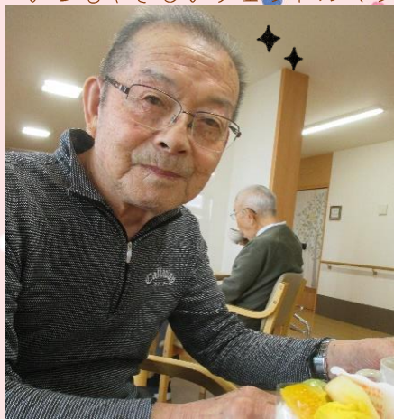
毎日ウォーキングおつかれさまです☆