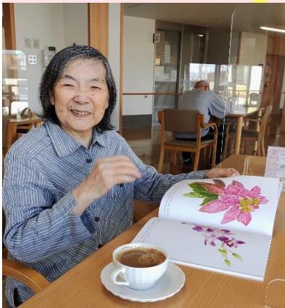
年齢を感じさせない姿は 日頃の努力の賜物ですね☆