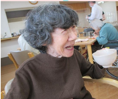
気配り上手でやさしいお母さま♡