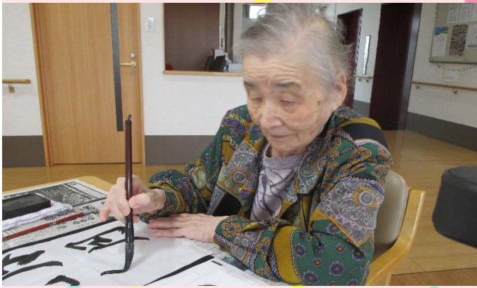
いつも笑顔がキュート♡ 脳トレや習字、お勉強も得意です。