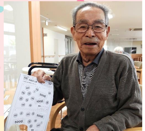
人生の大先輩 「人はいつまでも成長できる」 可能性が光っています☆

みんなの笑顔に会える場所 まさに！「ほっこりスローライフ」 元気を分け合い、お互いの良いところを見 つけあう素晴らしい仲間たちです♡