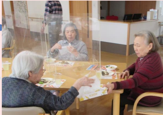
お互い気遣うマダム達「奥さん、どうぞ」