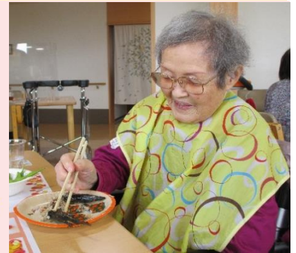
美味しいさんま!合格◎