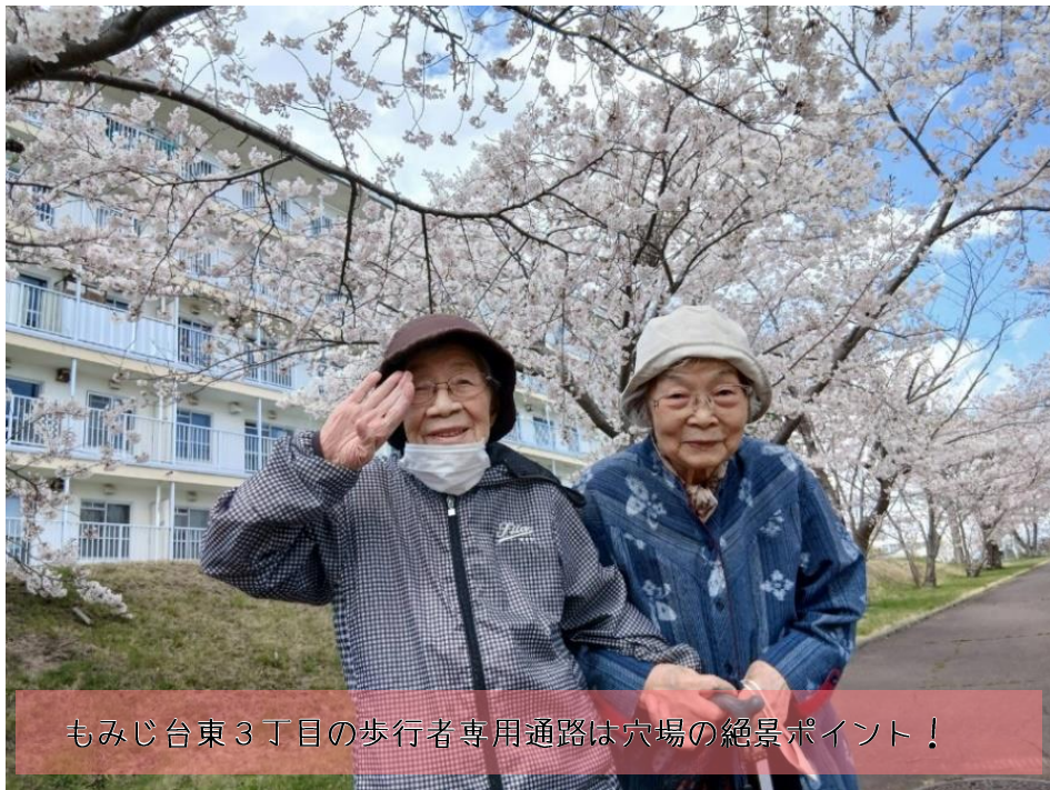
もみじ台東3丁目の歩行者専用通路は穴場の絶景ポイント！