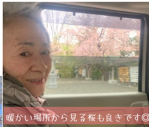
暖かい場所から見る桜も良きです◎