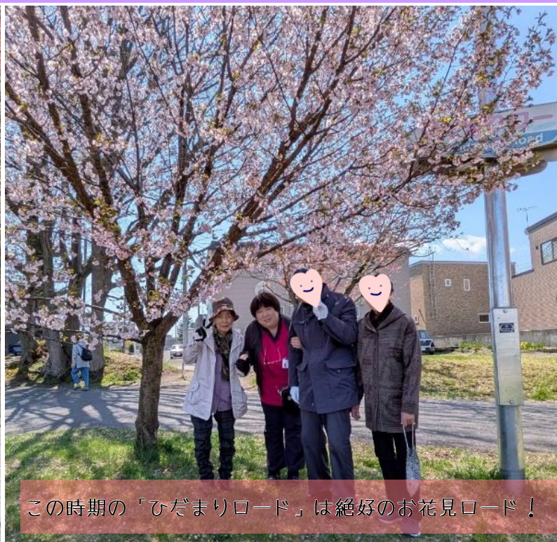
この時期の「ひだまりロード」は絶好のお花見ロード！